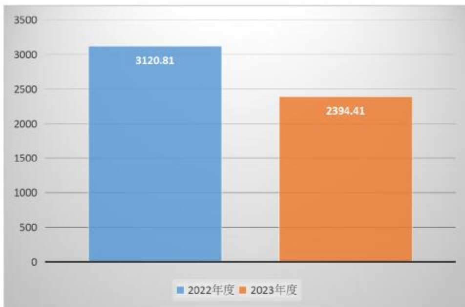
图 1: 2022-2023 年收支总计对比情况

本单位2023年度收、支总计（含结转和结余）2,394.41万元。与2022年度决算相比，收支各减少726.4万元，下降23.3%，主要原因是按照过紧日子原则大力压减项目经费。